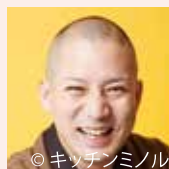
◎キッテンミノル 落語 春風亭一之輔

今、一番チケットの取れないNo.1落語家と、注目の若手たちによるこの日だけの落語会。全国各地の高座に上がり、人気テレビ番組「笑点」でもすっかりおなじみの一之輔。滑稽話から人情噺まで、両極端を鮮やかに演じ分ける自由自在な芸に、そして飄々とした佇まいながら、世相にチクリと毒を放つ巧みな話術にどうぞご注目。講談界の急先鋒 宝井琴鶴と若手噺家が一同に会する充実の公演。是非、お見逃しなく。