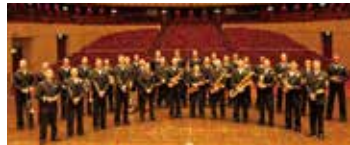
米海軍第7艦隊バンド