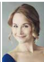
マール・マシュタリール (ソプラノ)