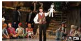
これまでの公演より