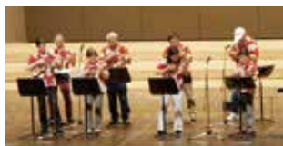
オペラハウスde演奏