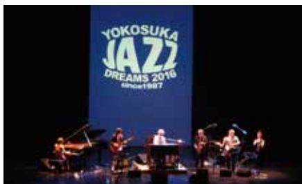
2016年のステージより