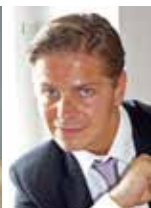
ミハエル・ハヴリチェク (バリトン)