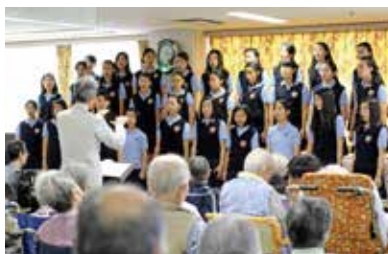
2016年 市内老人福祉施設にて

毎年、市内の老人福祉施設や医療施設を訪問して、ミニコンサートを行っています。劇場に足をお運びいただくことが難しい方々に、子どもたちの澄んだ美しい歌声と、元気とともに安らげるひと時をお届けしています。