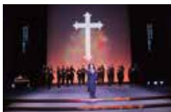
第2弾「トスカ」(2016年)より