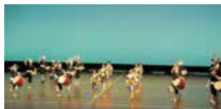
パフォーマー集まれ