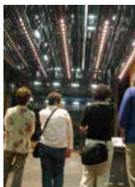
ミニ・バックステージツアー

※今年の劇場オープンデーは2017年2月19日(日)です。当日参加できるイベントもご用意しております。ぜひお越しください。