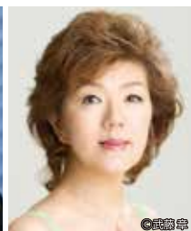
徳永二男(ヴァイオリン)