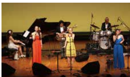
2016年のステージより