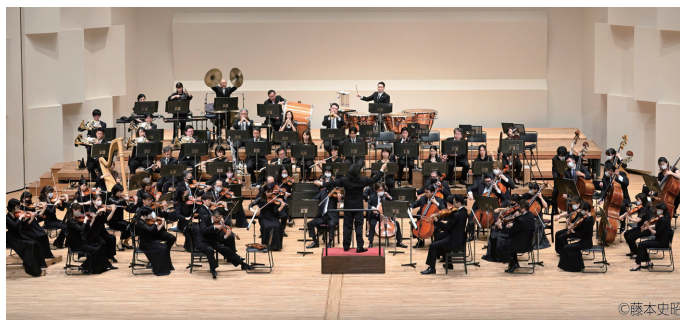
神奈川フィルハーモニー管弦楽団