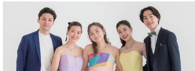
ザ ブリーズアドベンチャーズ

〈曲目〉となりのトトロより「となりのトトロ」 崖の上のポニョより「崖の上のポニョ」 天空の城ラピュタより「君をのせて」 魔法の宅急便より「魔法の宅急便」「やさしさに包まれたなら」 千と千尋の神隠しより「ふたたび」 もののけ姫より「もののけ姫」「アシタカとサン」 ほか