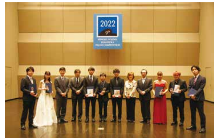
入賞者・入選者たちと審査委員