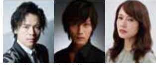
中川晃教 加藤和樹 ソニン

超豪華!ミュージカル歌手のスターたちがオーケストラをバックに選りすぐりのナンバーを歌い上げる!