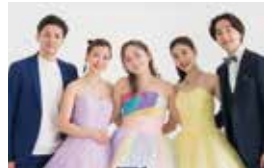
ザプリースアドベンチャーズ(歌)

〈曲目〉となりのトトロより「となりのトトロ」 天空の城ラピュタより「君をのせて」 魔法の宅急便より「魔法の宅急便」「やさしさに包まれたなら」 もののけ姫より「もののけ姫」「アシタカとサン」 ほか