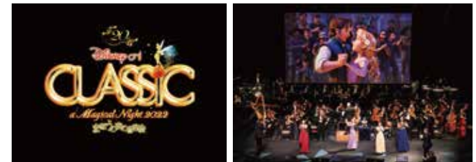
※ステージ写真は過去の公演です。