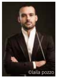
レオナルド・シーニ

〈指揮〉レオナルド・シーニ 〈演出〉ロッテ・デ・ベア 〈出演〉フィリッポII世:妻屋秀和 ドン・カルロ:城 宏憲 ロドリゴ:清水勇磨 宗裁裁判長:大塚博章 修道士:清水宏樹 エリザベッタ:木下美穂子 エポリ公女:加藤のぞみ テバルド:守谷由香 レルマ伯爵&王室の布告者:児玉和弘 天よりの声:雨笠佳奈 6人の代議士:岸本 大/寺西一真/外崎広弘/宮城島 康/宮下嘉彦/目黒知史